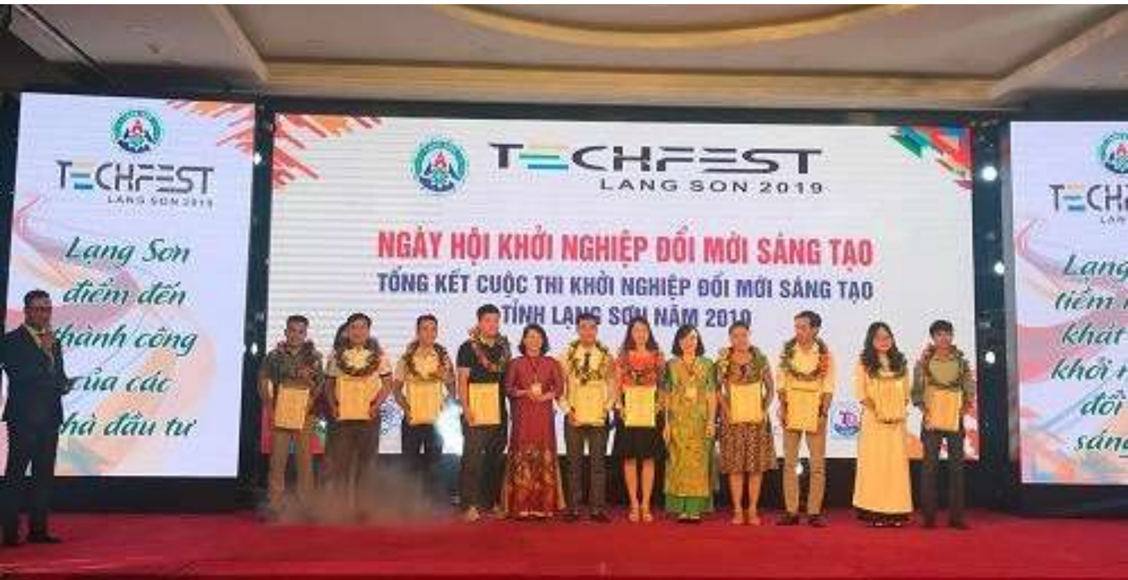
Đại diện các startup tham gia Chung kết Cuộc thi khởi nghiệp đổi mới sáng tạo tỉnh Lạng Sơn