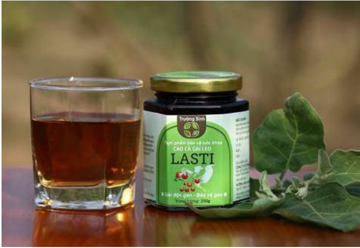
Cà gai leo Lasti-một thương hiệu được nhiều người yêu thích.

trên thị trường mà lựa chọn các nhà phân phối có uy tín trong lĩnh vực y học cổ truyền để có thêm tư vấn hiệu quả cho người sử dụng.