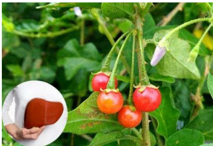
Cà gai leo (tên khoa học: Solanum procumbens)